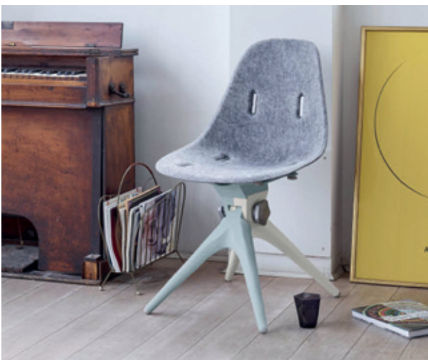
Pentatonic AirTool Chair, un modèle d'économie circulaire